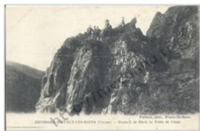
ARONA - VILLAVARDA (Piemonte) - Chiesa di Santa Maria di Castello