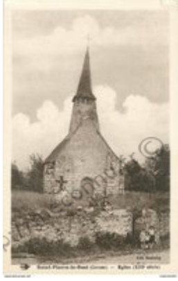
Église de Saint-Étienne - 1870